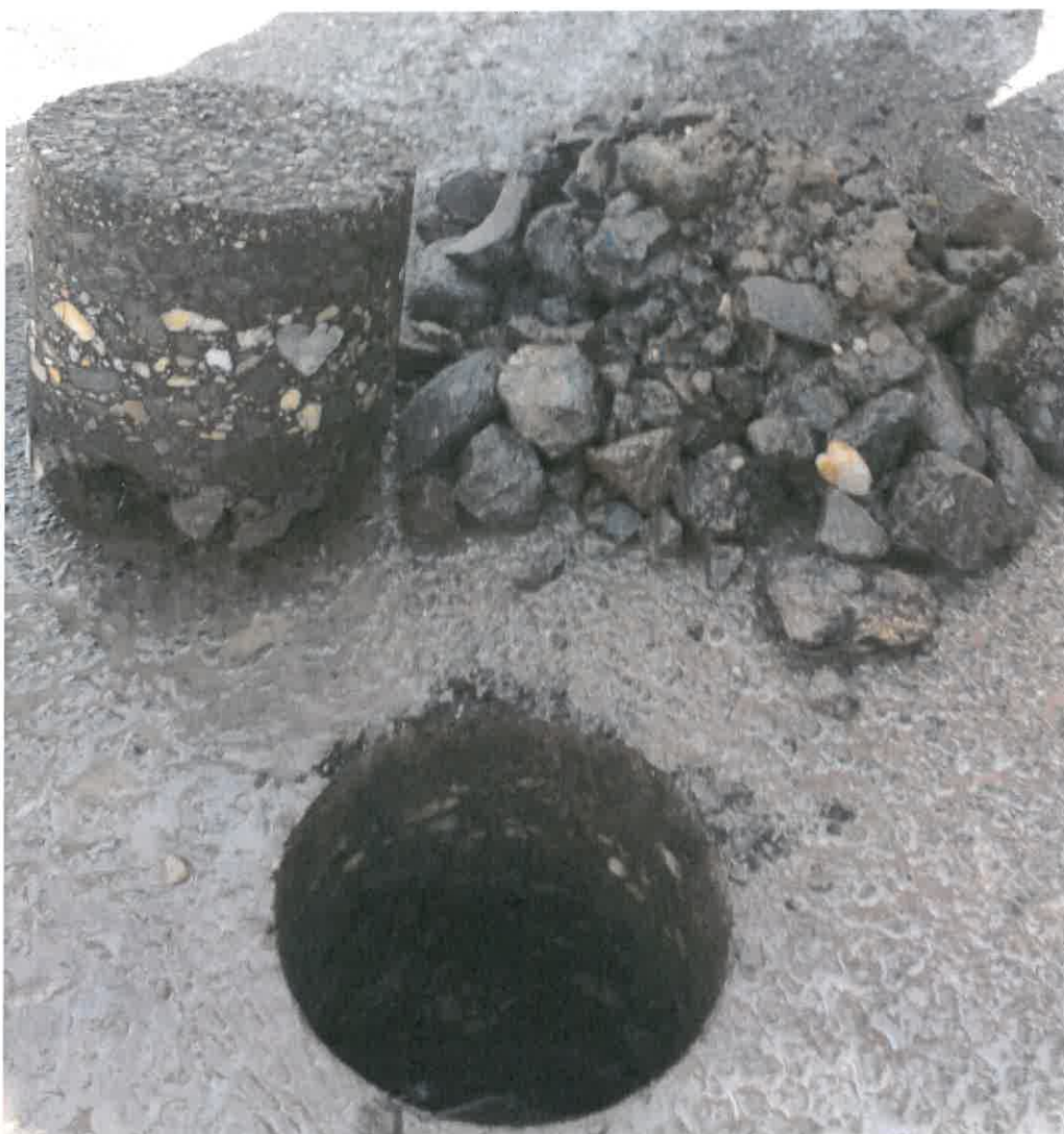
3. kép: Fúrást követően Nyíregyháza, Sóstói út és Szinbád sétány 1+500 km. sz. bal oldal tengelytől 2,3 m

Rétegfelépítés: 17 mm felületi bevonat (8 mm szemnagyság) 24 mm aszfaltbeton (11 mm szemnagyság) 53 mm aszfaltbeton (22 mm szemnagyság, kavicsaszfalt) 20 mm aszfaltbeton (8-11 mm szemnagyság) kb. 210-215 mm zúzottkő alapréteg Tükörszint (homok talaj)