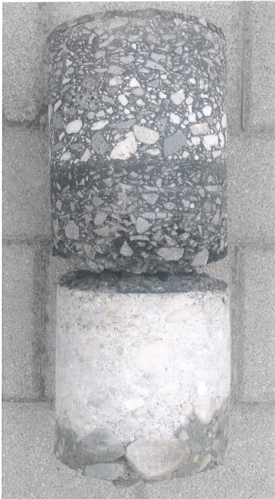
2. kép: Fúrt minta Nyíregyháza, Sóstói út és Szinbád sétány 0+500 km. sz. jobb oldal tengelytől 3,0 m