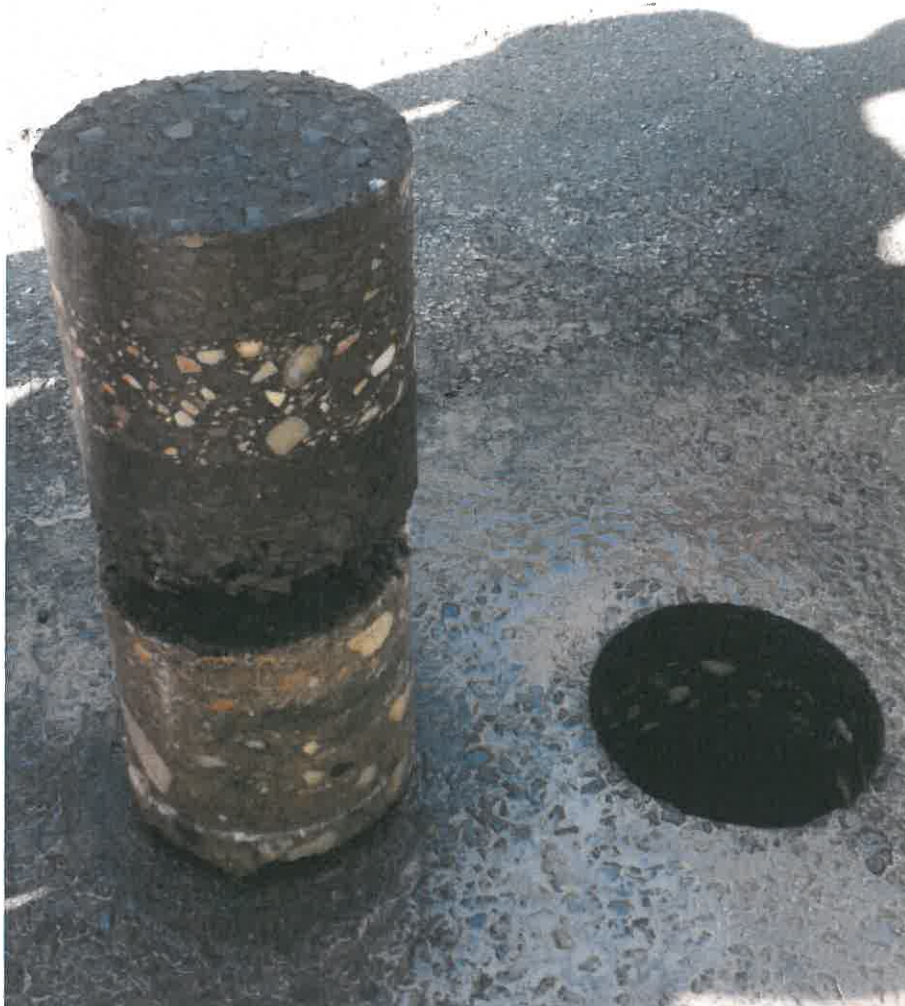
1. kép: Fúrást követően Nyíregyháza, Sóstói út és Szinbád sétány 0+500 km. sz. jobb oldal tengelytől 3,0 m